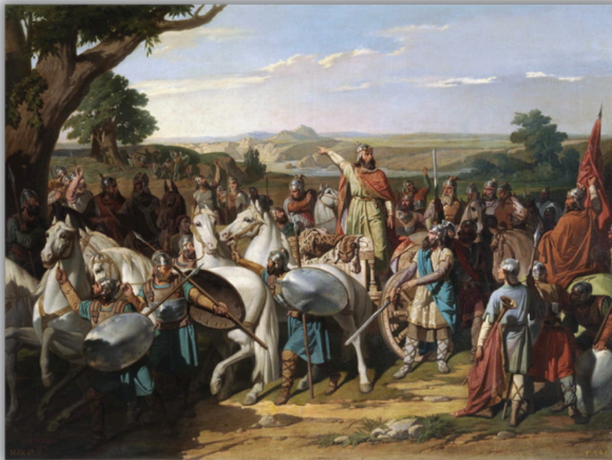
El rey Don Rodrigo arengando a sus tropas en la batalla de Guadalete, cuadro de Bernardo Blanco y Pérez (1871) en el Museo del Prado.